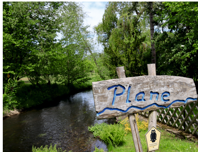
An der Plane mit ihren Forellenhöfen bietet sich manch lauschiges Plätzchen für eine kleine Rast...