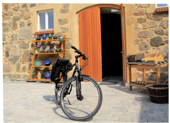
Töpferei Königsblau in Schmerwitz